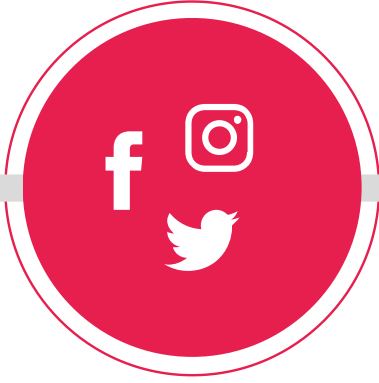
İNTERNET VE SOSYAL MEDYA