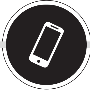
TELEFON VE TABLET