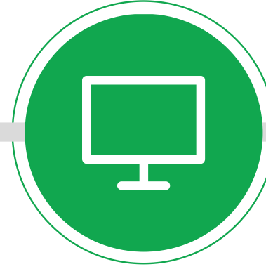
BİLGİSAYAR VE TELEVİZYON